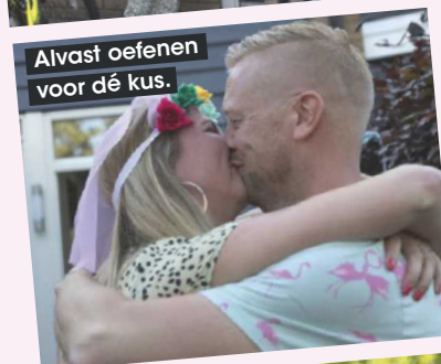
Alvast oefenen voor dé kus.