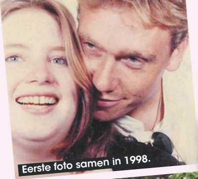
Eerste foto samen in 1998.