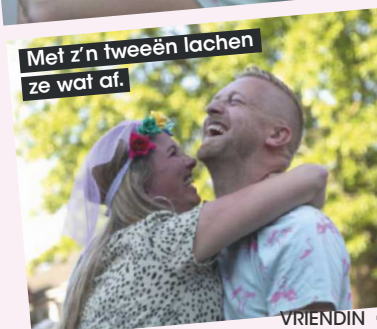
Met z'n tweeën lachen ze wat af.