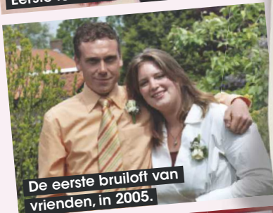
De eerste bruiloft van vrienden, in 2005.