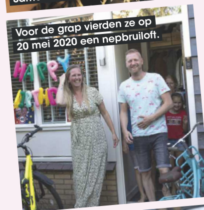
Voor de grap vierden ze op 20 mei 2020 een nepbruiloft.