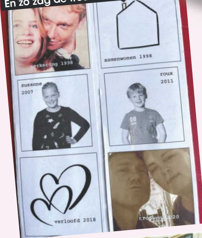
Changed the date naar de nieuwe trouwdatum.