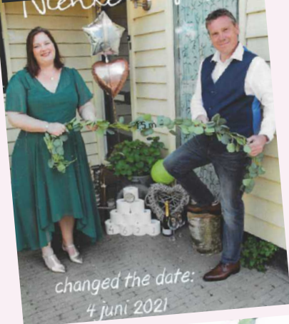
changed the date: 4 juni 2021