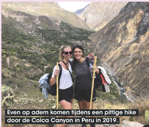
Even op adem komen tijdens een pittige hike door de Colca Canyon in Peru in 2019.

‘Ons favoriete drankje als we iets te vieren hebben: champagne’