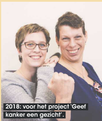
2018: voor het project 'Geef kanker een gezicht'.