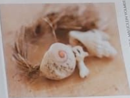
ILLUSTRATIE: VIBRANT